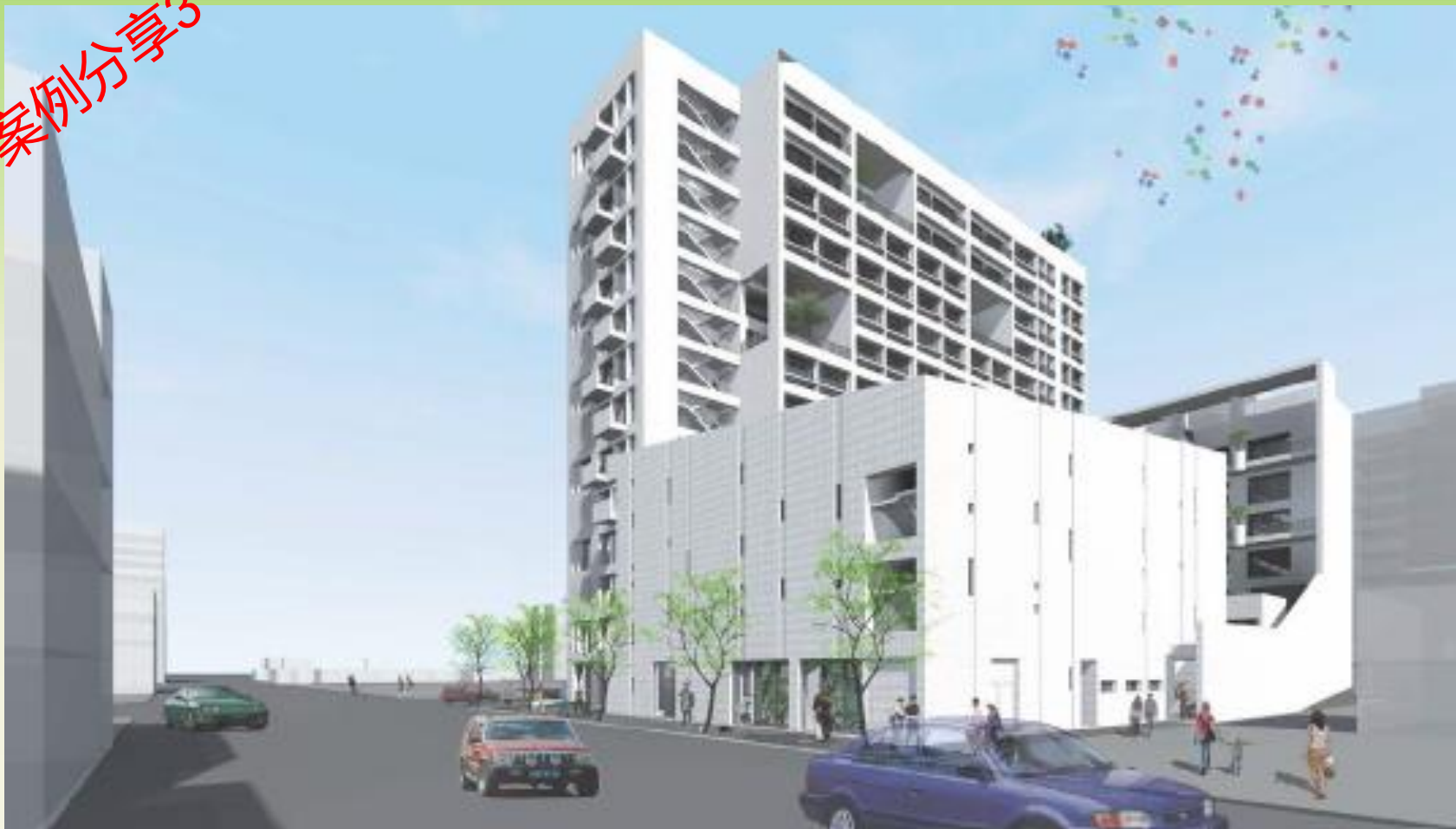
多元智慧健康樂齡住宅