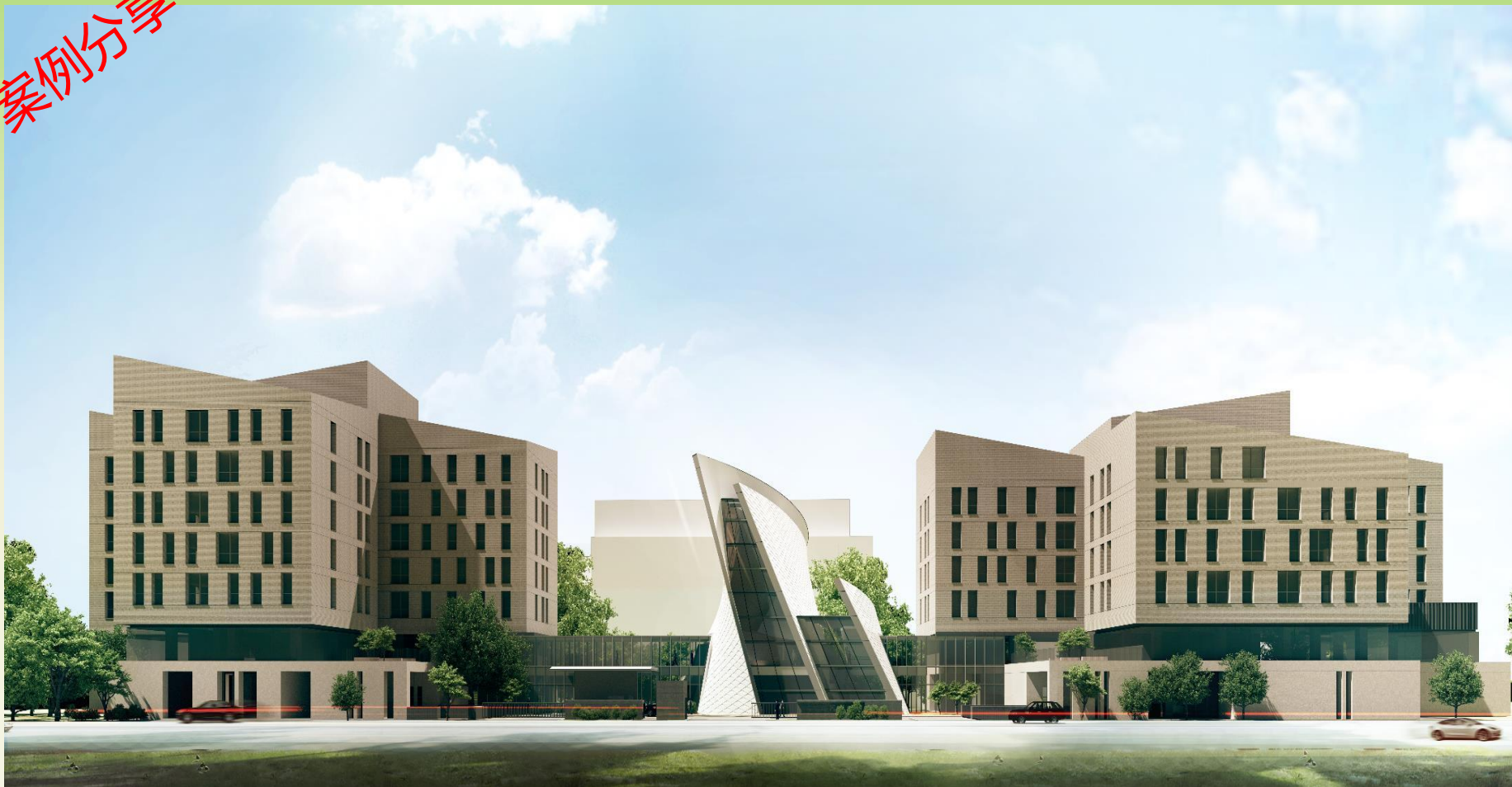
多元智慧健康樂齡住宅