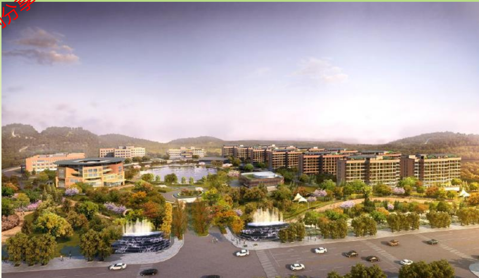
多元智慧健康樂齡住宅