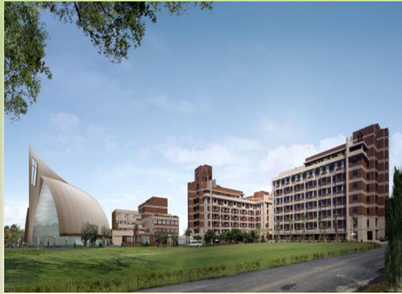
多層級連續性照顧機構 --雙連安養中心