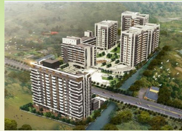
多元智慧健康樂齡住宅 --日初不老莊園