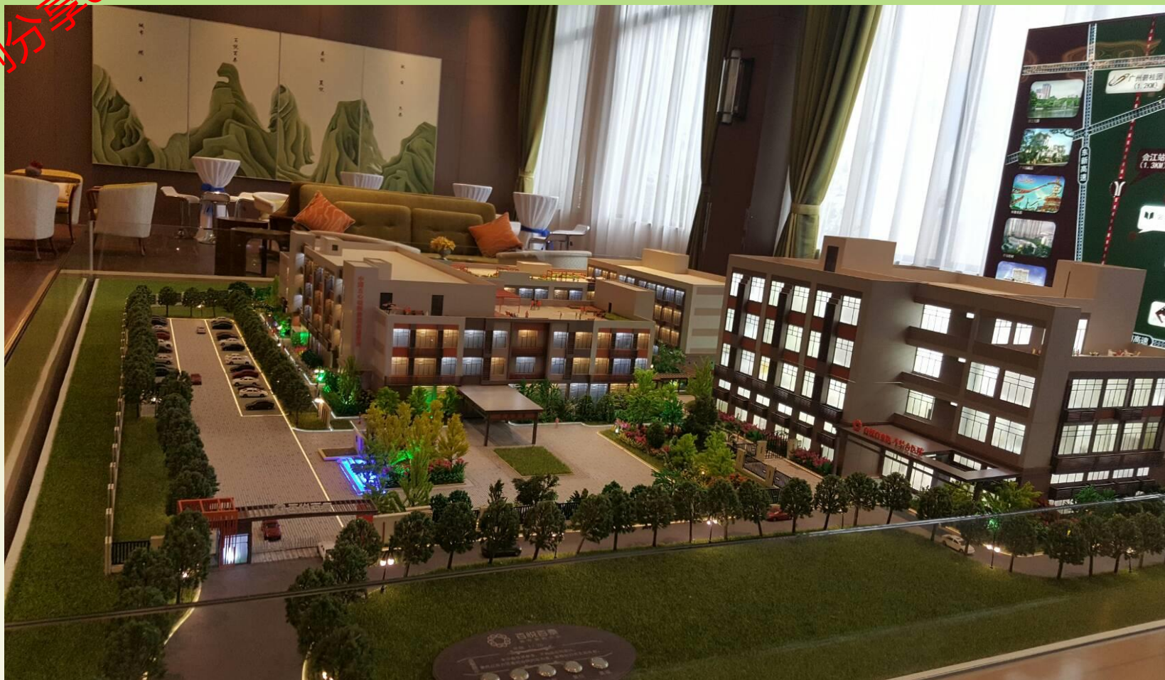
多元智慧健康樂齡住宅