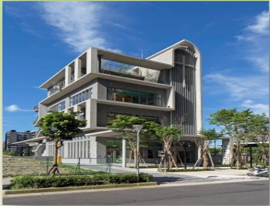
長照 2.0 社區及居家式服務 --雙連新莊社福中心